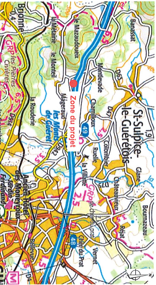
Carte IGN - géoportail.fr - Echelle : 1/40 000ème